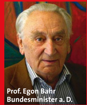
Prof. Egon Bahr Bundesminister a. D.