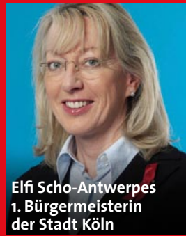
Elfi Scho-Antwerpes 1. Bürgermeisterin der Stadt Köln